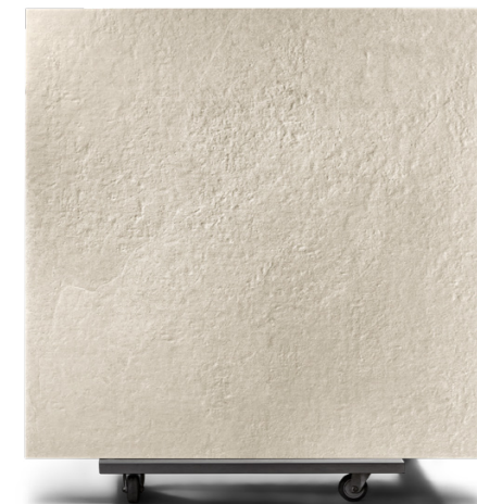
Ipanema Posto 10